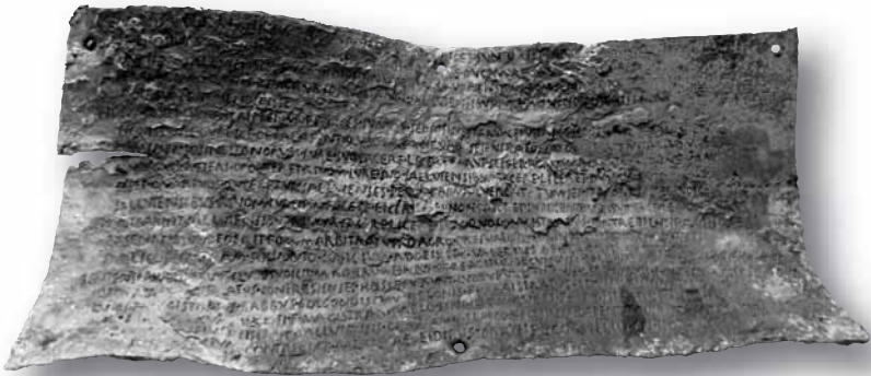
Bronze de Contrebia Belaisca.